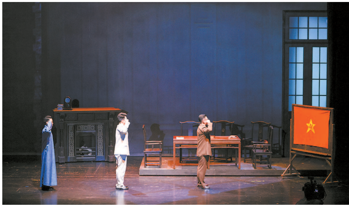
沪上原创民族歌剧《义勇军进行曲》日前进行多场公益演出，为大思政课建设提供了激情澎湃的艺术党课。本报记者 叶辰亮摄

思政课是落实立德树人根本任务的关键课程。党的十八大以来，习近平总书记高度重视思政课建设，发表了一系列重要讲话，作出了一系列重要指示、批示，提出了一系列重要部署，指明了办好思政课的根本任务、方向目标、方法路径，为建设新时代“大思政课”提供了科学指引和强大动力。如何深刻认识思政课建设重要性？新时代新征程上，思政课建设面临怎样的新形势新任务？如何把道理讲深讲透讲活，推动思政课建设内涵式发展，不断提高思政课的针对性和吸引力？本报约请三位专家研讨交流。