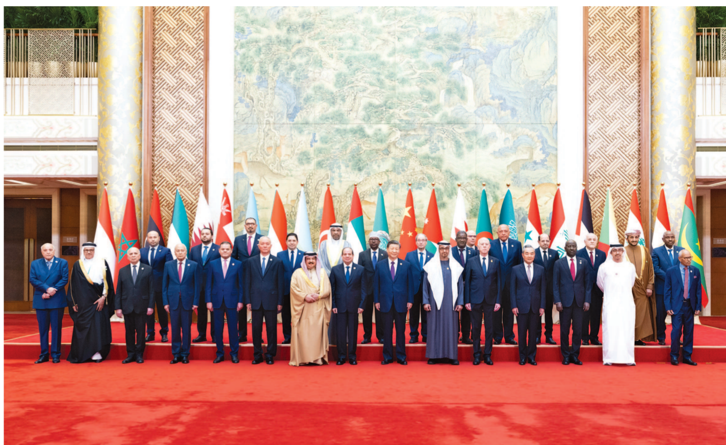
习近平同巴林国王哈马德、埃及总统塞西、突尼斯总统赛义德、阿联酋总统穆罕默德、阿盟秘书长盖特以及22位阿拉伯国家代表团团长集体合影。