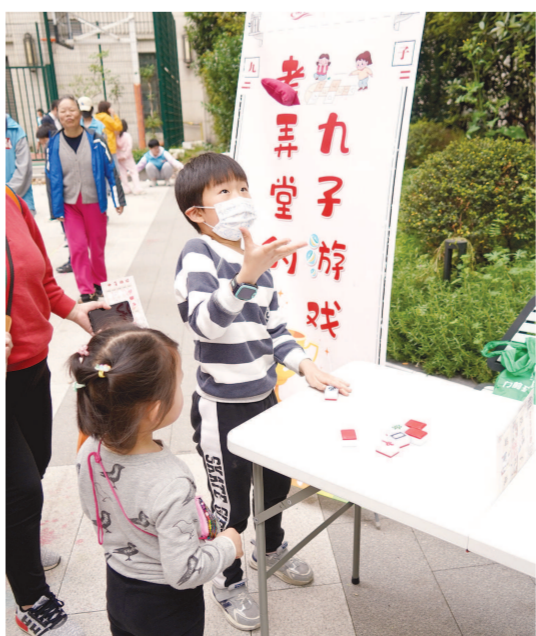
社区儿童参与“情聚可爱里”活动。

今年“五一”国际劳动节前夕，黄浦区首个新时代城市建设者管理者之家党群服务站在豫园街道成立。同日，黄浦区建设管理党工委和豫园街道党工委联合成立豫园新时代城市建设者管理者党建联席会议。 组建新时代城市建设者管理者之家党群服务站，是迫在眉睫的探索。 近年来，豫园街道进入多个城市更新项目集中建设期。1.19平方公里辖区内，共有10个建设项目，这些项目总占地面积占辖区面积比例达41.2%，投资体量大，建设周期长，对区域经济发展转型有重大战略意义。 密集建设周期内，有大量工地建设者、管理者在此集聚，需要相应的服务供应，邻避效应也必然带来较多涉建矛盾。如何以党建引领强化条块联动，高效推动城市更新项目建设，依托党群阵地为众多外来务工人员做好服务保障，这是街道及建设管理部门聚焦的城市治理课题。 为此，豫园街道党工委会同区建设管理党工委联合调研，多次讨论磋商，共同牵头组建豫园新时代城市建设者管理者党建联席会议，积极回应城市建设者管理者的急难愁盼。 该联席会议，整合了与城市更新建设相关的监管主体、建设主体、链接服务保障等区域化单位，强化问题导向、系统思维，打造条块协同、多方联动的责任体系，织密到底边经路畅通的组织网络，提升城市更新项目精细化管理效能，精准服务新时代城市建设者管理者，营造和谐建设环境，打造上海中心城区党建引领下条块协同、多方联手、高品质高效能推进城市更新建设的豫园实践、黄浦样本。 豫园新时代城市建设者管理者党建联席会议主要是由“一平台三组团九项目”组成，以党群阵地建设、运作体系建设、项目管理建设形成党建引领条块协同联动的工作格局。推进文明工地创建项目、综合监管项目、智慧工程试点项目、医疗服务项目、生活关爱项目、赋能提升项目、“三会”进工地项目、“九曲桥工作法”提升项目、第二梯队共治项目9个项目，促进组织互动、工作互联、经验互鉴、成果共享，推动豫园城市更新，也温暖城市建设者。