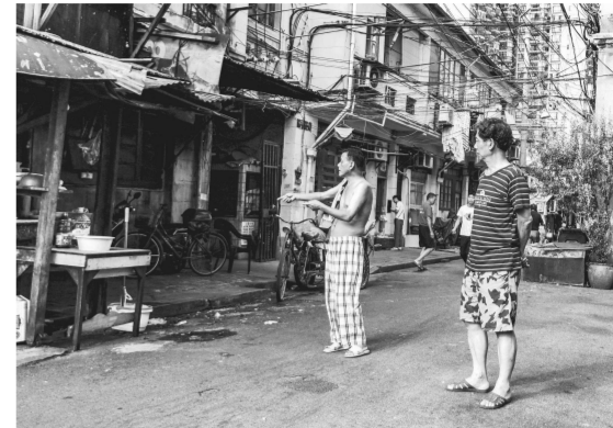
豫园街道往日街景。