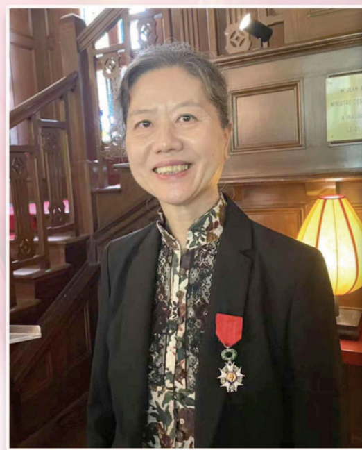
▲王安忆。 ▲法国总统马克龙签发的荣誉证书。 制图：冯晓瑜

非常荣幸站在这里，接受法兰西共和国荣誉军团勋章，不仅在于军团勋章本身具有的光彩，更因为这是我们的巴金先生得到过的荣誉，这增添了它的重要意义。我并不认为，因此就可以狂妄地以为，和巴金先生在同一高度，相反，它给我自省的机会，检视我和巴金先生以及他的同时代作家的差异和距离，于是，不禁感到羞惭。