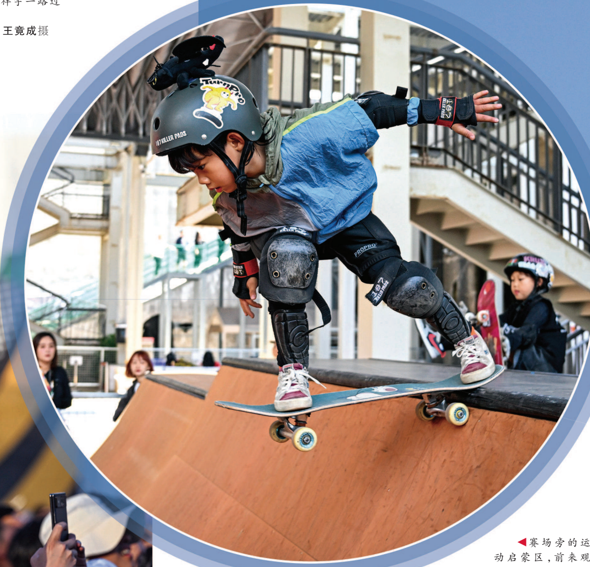
◀赛场旁的运动启蒙区,前来观赛的滑板小爱好者全副武装体验滑板U型池。