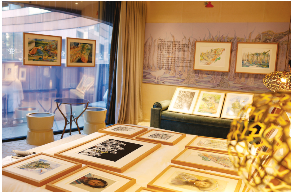
将客房作为展示空间，艺术品的价值可以延伸至个人生活和内心世界。

推开“锦瑟画廊”的房门，双人床床头最中间的位置，挂着超现实主义艺术家达利的石版画《寻找第四度空间》。画中的软时钟是对时空的持续探讨，画中人试图超越传统的三维空间，向第四维度进发。“超越时间和空