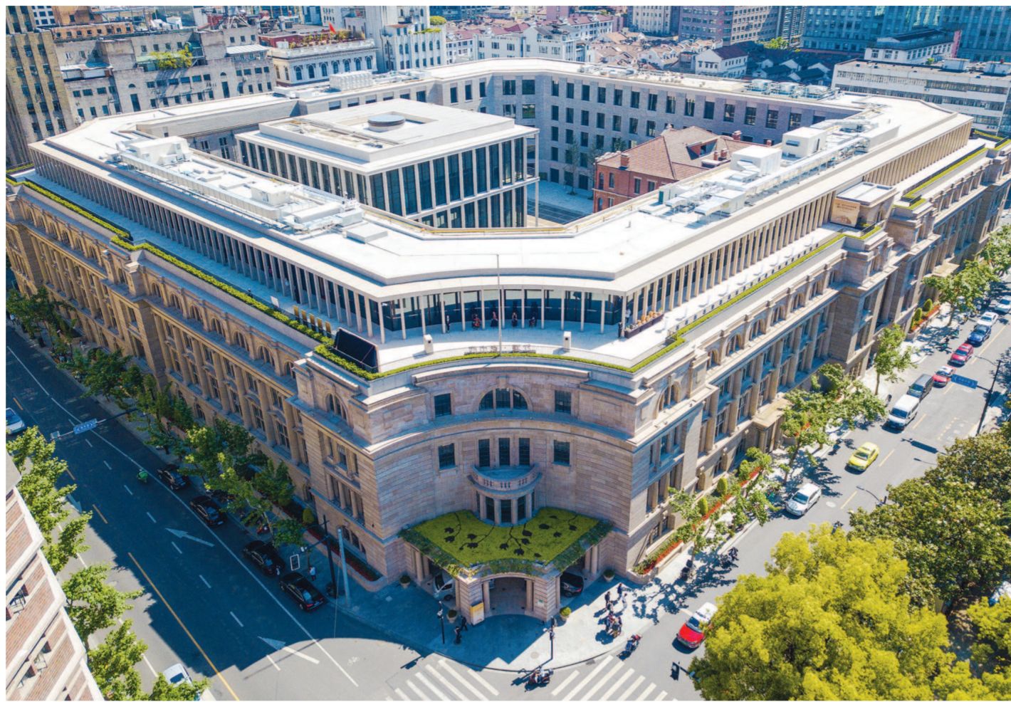
老市府大楼将以焕然一新的面貌和复合型功能业态回归。