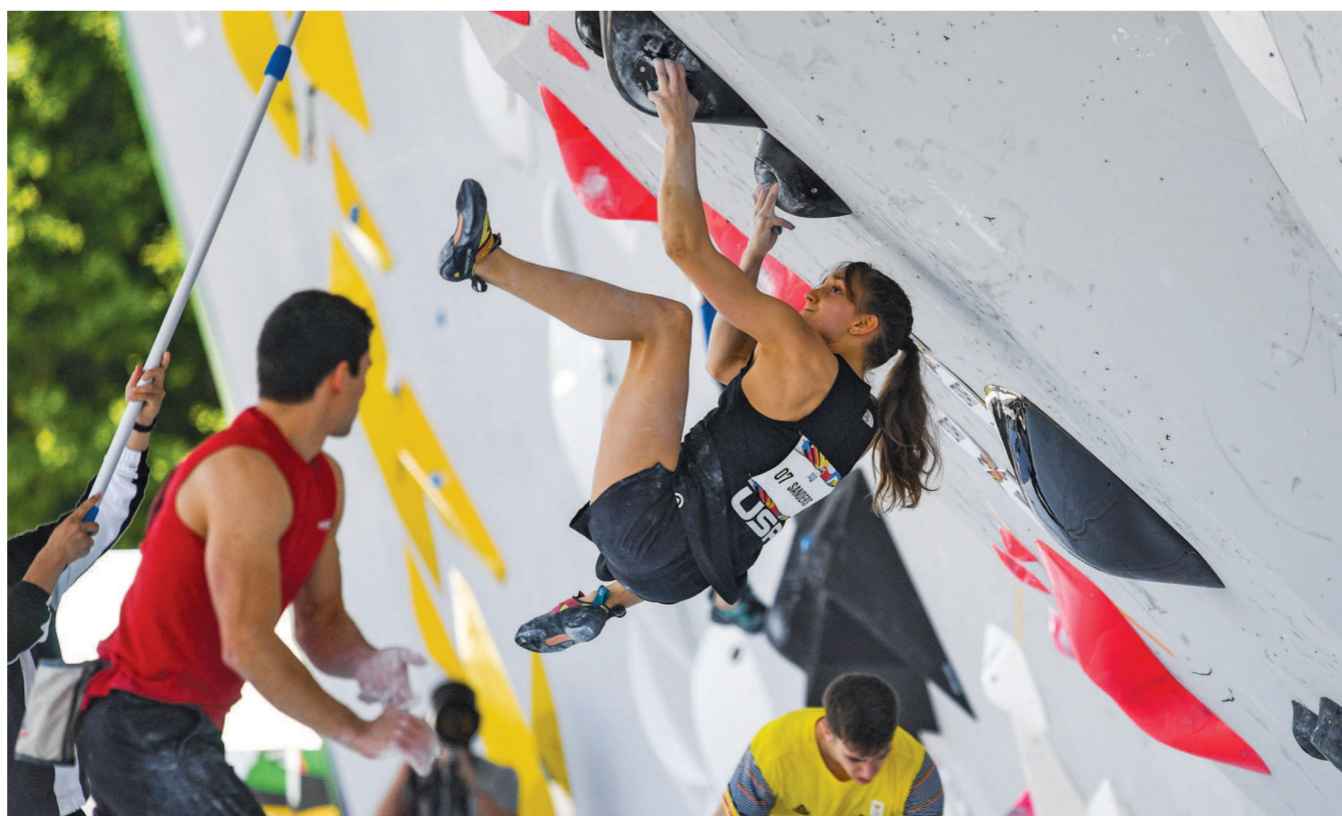
“把自由式小轮车、滑板、霹雳舞和攀岩组成的四个新兴项目的资格赛融入音乐、时尚、当地文化的环境之中”,由国际奥委会全新打造的节日型赛事——首届奥运会资格系列赛昨起在上海展开为期四天的争夺。图为攀岩两项全能攀岩预赛。