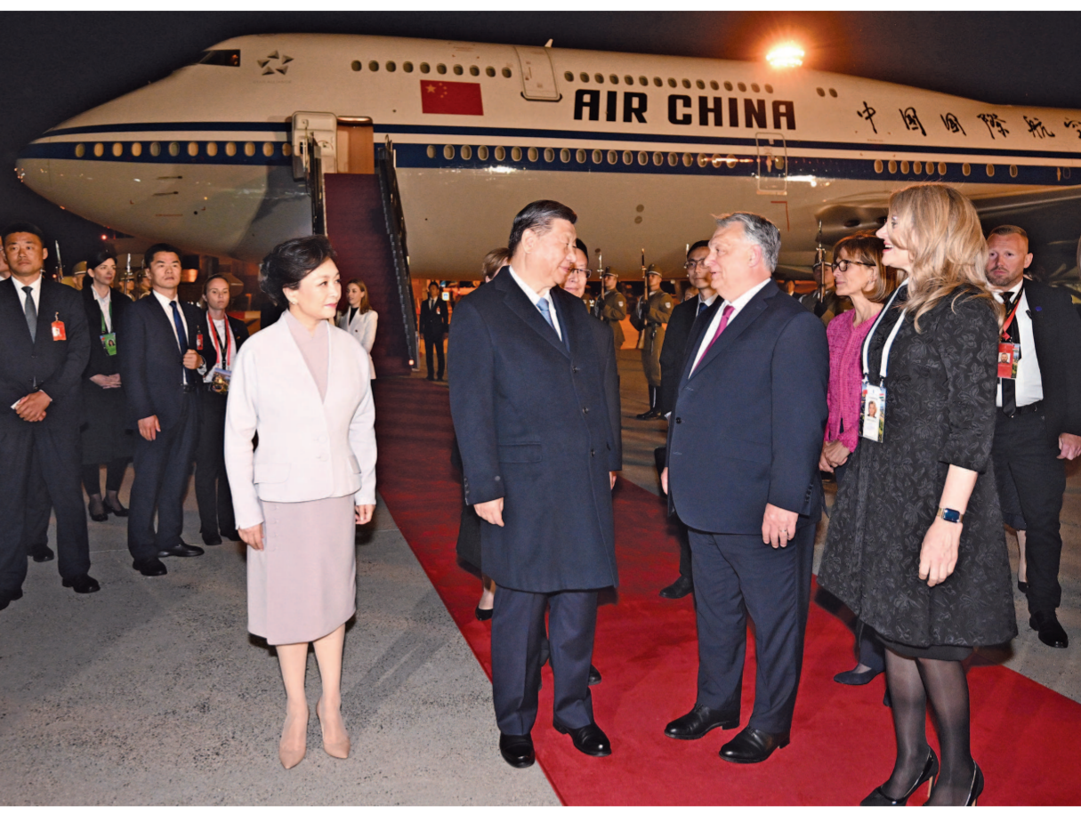
当地时间5月8日晚，国家主席习近平乘专机抵达布达佩斯，应匈牙利总统舒尤克和总理欧尔班邀请，对匈牙利进行国事访问。匈牙利总理欧尔班夫妇、外长西雅尔多等政府高级官员在机场热情迎接习近平和夫人彭丽媛。

(上接第一版) 中方愿同匈方继续引领共建“一带一路”合作和中国—中东欧国家合作正确方向，推动合作走深走实。希望匈方以今年下半年担任欧盟轮值主席国为契机，推动中欧关系平稳健康发展。