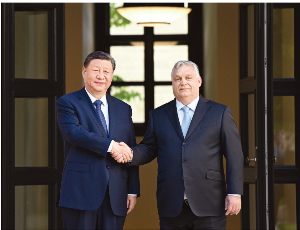
当地时间5月9日下午，国家主席习近平在布达佩斯总理府同匈牙利总理欧尔班举行会谈。