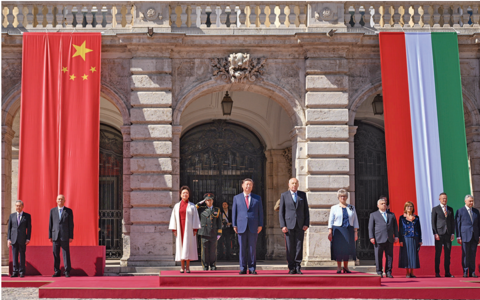
当地时间5月9日上午，国家主席习近平在布达佩斯出席匈牙利总统舒尤克和总理欧尔班共同举行的隆重欢迎仪式。