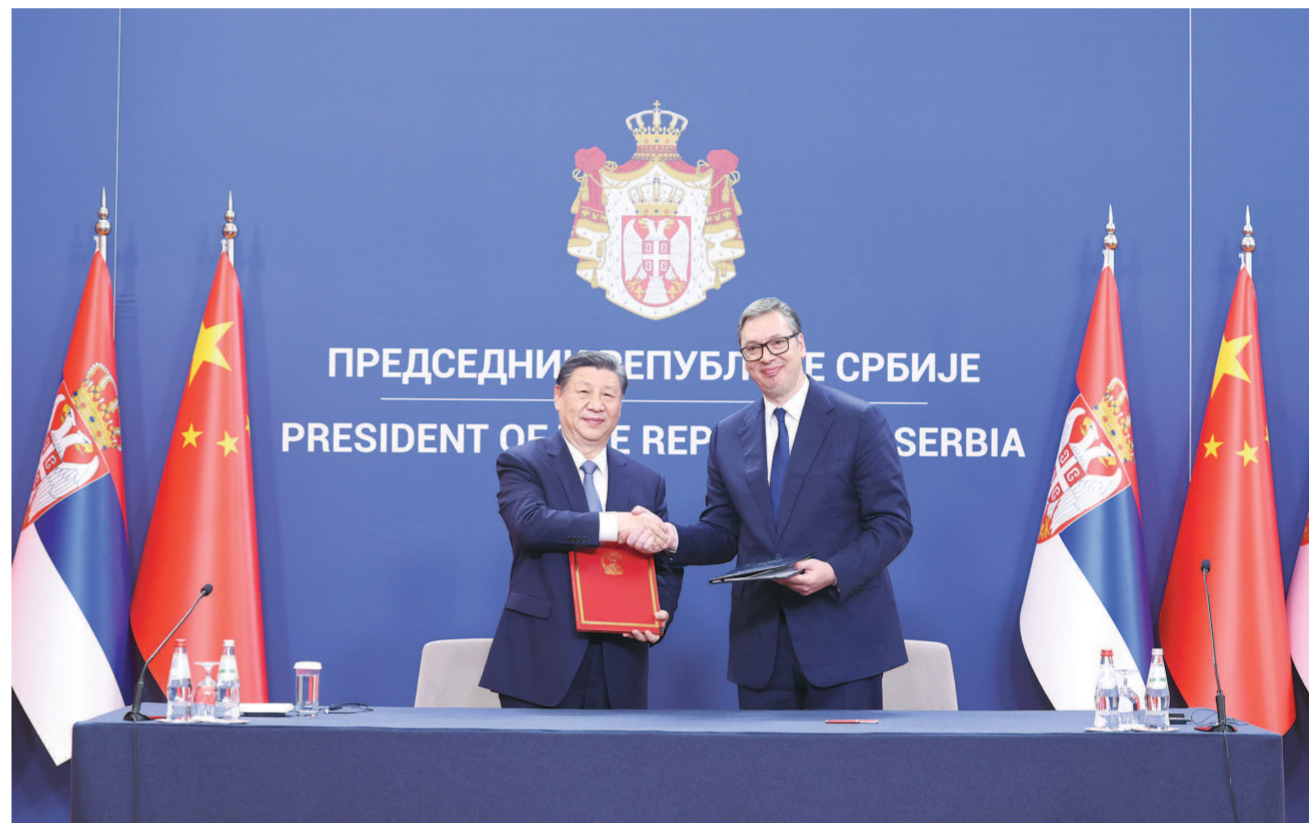
当地时间5月8日上午,国家主席习近平在贝尔格莱德塞尔维亚大厦同塞尔维亚总统武契奇举行会谈。会谈后,两国元首共同签署《关于深化和提升中塞全面战略伙伴关系、构建新时代中塞命运共同体的联合声明》。