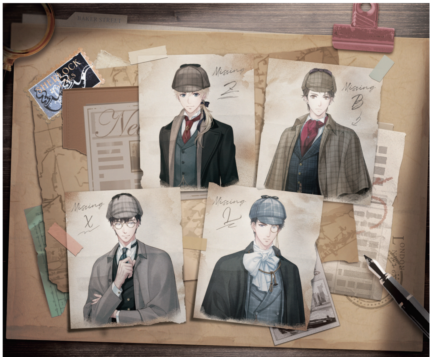
图片说明:据房东太太回忆绘制出的肖像,图源游戏。