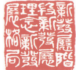
新发展阶段 新发展理念 新发展格局 篆刻:吴军

李伟:面对“中国产能过剩论”,中国需要加强沟通重视合作,为“向绿共赢”创造有利环境。从国际产业发展经验看,新兴产业快速发展,替代传统产业实现产业升级,会产生由于传统产业退出市场导致的就业结构调整、收入分配等问题,这些问题解决不好也会严重影响新兴产业的发展。中国电动汽车出口有效推动了相关国家的产业升级,同时也需要高度关注产业转型发展在客观上带来的就业和收入分配等问题,需要关注相关国家的重要关切,加强沟通协调,在坚持公平竞争和开放合作原则的基础上,开展有效合作,积极应对产业转型带来的相关问题。重视加强与相关国家的合作,成果共享和产业链配套协同,积极推动进口国相关产业的快速发展,为绿色低碳产业特别是电动汽车产业领域的全球共赢发展,作出积极努力和重要贡献。