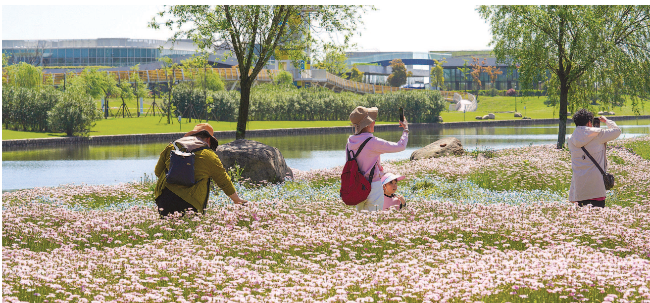
“花漾年轻城”2024上海(国际)花展临港主会场开幕仪式现场。