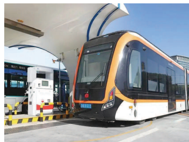
在临港新片区运行的氢能驱动中运量公交线路。