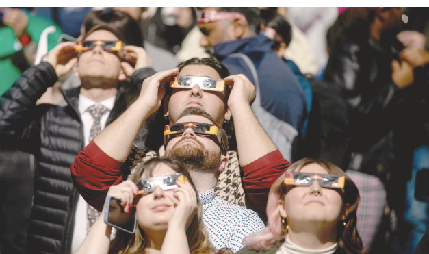
4月8日,人们在美国纽约附近观看日食。