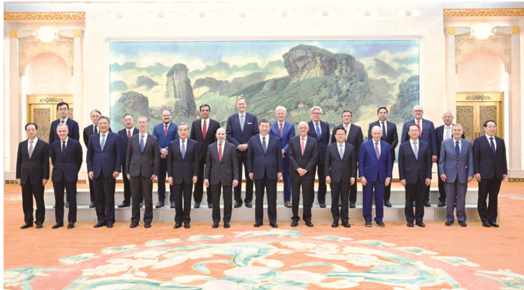
3月27日,国家主席习近平在北京人民大会堂集体会见美国工商界和战略学术界代表。