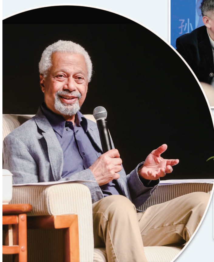
▲诺贝尔文学奖得主阿卜杜勒扎克·古尔纳。