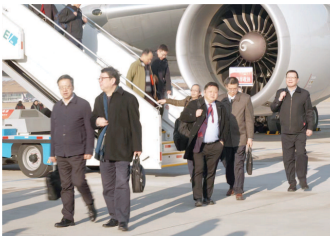
在沪全国政协委员抵京参会。