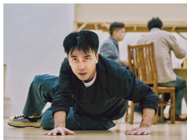
一批舞台精品于近日相继开票,用实打实的票房彰显红色佳作的涟漪效应。图为话剧《千里江山图》排练照。