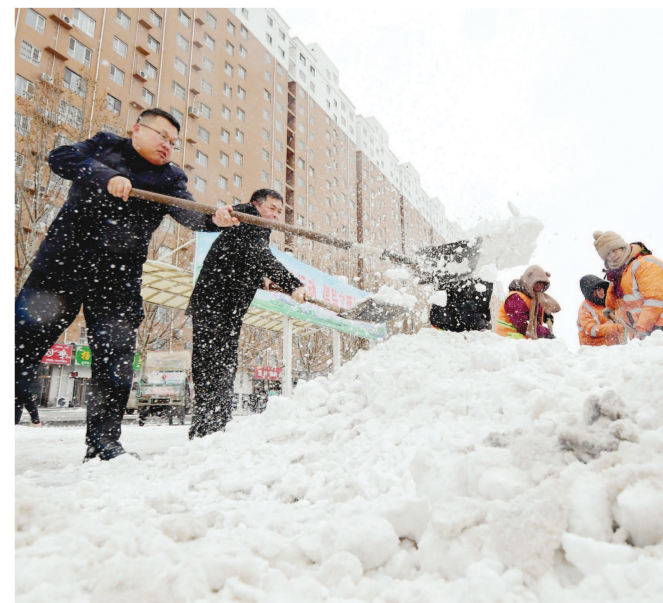
2月21日,河北省邯郸市成安县环卫工人和居民在城区主干道上清除积雪。