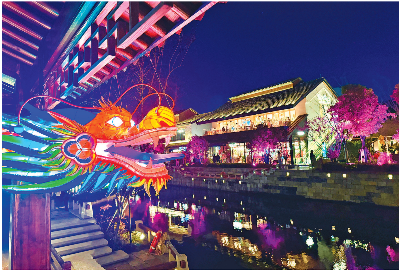
龙年新春,年味正浓,图为巨型龙灯在青浦蟠龙天地街巷间穿梭,带来了龙乡江南民俗特色风情。

不仅如此,在全市多个商圈、文化场馆、景区、公园、地铁站点、浦江游船等场所,市民游客也都能参与线上寻龙打卡活动,例如豫园商城的“山海奇缘记”灯会、上海博物馆