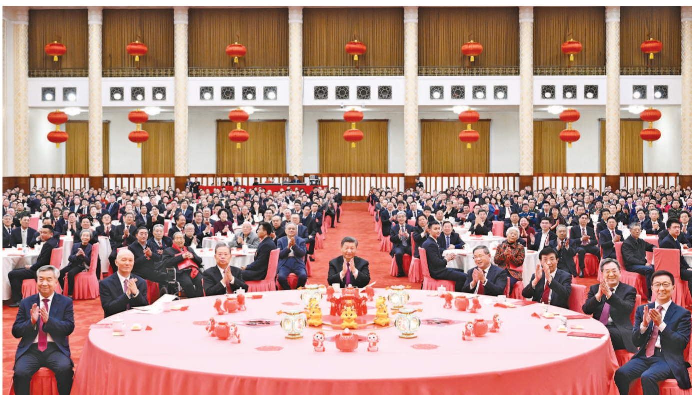
2月8日,中共中央、国务院在北京人民大会堂举行2024年春节团拜会。党和国家领导人习近平、李强、赵乐际、王沪宁、蔡奇、丁薛祥、李希、韩正等同首都各界人士齐聚一堂,共迎新春。