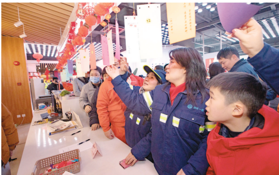
留沪过年的劳动者们在静安区党建服务中心猜灯谜。