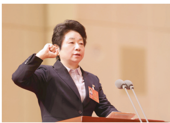
昨天上午,市十六届人大二次会议宪法宣誓仪式举行。新当选的市人大常委会主任黄莉新进行宪法宣誓。

本报讯 上海市第十六届人民代表大会第二次会议昨天举行第二次全体会议。大会补选黄莉新为市人大常委会主任。大会执行主席是陈吉宁、黄莉新、郑钢淼、周慧琳、宗明、陈靖、张全、徐毅松、朱勤皓、顾云豪、谈上伟、程绣明。大会由执行主席陈吉宁主持。本次会议应到代表851名,实到799名,合乎法定人数。会议首先表决通过了总监票人和监票人名单。接着,大会以无记名投票方式,补选市人大常委会主任、委员。根据计票结果,陈吉宁宣布:黄莉新当选为市人大常委会主任。在热烈的掌声中,陈吉宁与黄莉新握手,表示祝贺。黄莉新向代表们鞠躬致意。会议补选王志清、邬斌、刘艳、刘宜勇、何大军、张华、谢榕榕等7名市人大代表为市人大常委会委员。会议举行了宪法宣誓仪式。新当选的市人大常委会主任黄莉新和新当选的市人大常委会委员进行了宪法宣誓。出席大会的市领导还有:龚正、李仰哲、赵嘉鸣、朱芝松、张为、陈金山、李政、胡世军、张小宏、刘多、华源、张亚宏、陈宇剑、舒庆、彭沉雷、蒋卓庆、贾宇、陈勇,老同志殷一璀等也在主席台就座。