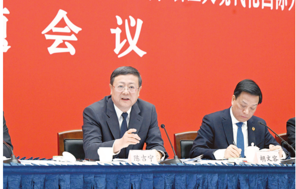
1月24日,市委书记陈吉宁参加市政协十四届二次会议专题会议。

本报讯 上海市第十六届人民代表大会第二次会议昨天举行第二次全体会议。大会补选黄莉新为市人大常委会主任。大会执行主席是陈吉宁、黄莉新、郑钢淼、周慧琳、宗明、陈靖、张全、徐毅松、朱勤皓、顾云豪、谈上伟、程绣明。大会由执行主席陈吉宁主持。本次会议应到代表851名,实到799名,合乎法定人数。会议首先表决通过了总监票人和监票人名单。接着,大会以无记名投票方式,补选市人大常委会主任、委员。根据计票结果,陈吉宁宣布:黄莉新当选为市人大常委会主任。在热烈的掌声中,陈吉宁与黄莉新握手,表示祝贺。黄莉新向代表们鞠躬致意。会议补选王志清、邬斌、刘艳、刘宜勇、何大军、张华、谢榕榕等7名市人大代表为市人大常委会委员。会议举行了宪法宣誓仪式。新当选的市人大常委会主任黄莉新和新当选的市人大常委会委员进行了宪法宣誓。出席大会的市领导还有:龚正、李仰哲、赵嘉鸣、朱芝松、张为、陈金山、李政、胡世军、张小宏、刘多、华源、张亚宏、陈宇剑、舒庆、彭沉雷、蒋卓庆、贾宇、陈勇,老同志殷一璀等也在主席台就座。