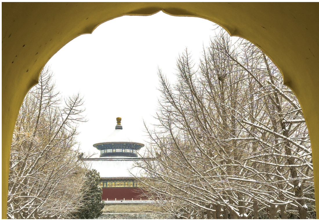
雪中的天坛公园新年版

编者按 习近平总书记在致世界中国学大会·上海论坛的贺信中说:“希望各国专家学者当融通中外文明的使者,秉持兼容并蓄、开放包容,不断推进世界中国学研究,推动文明交流互鉴,为繁荣世界文明百花园注入思想和文化力量。”