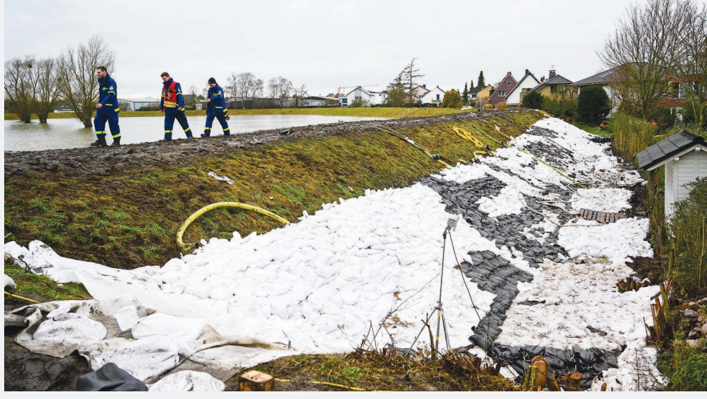
27日，工作人员在德国哈姆的一处河堤上进行固堤防涝工作。

德国、比利时、荷兰等国属于温带海洋性气候，较少出现酷暑严寒，全年降水均匀，洪涝灾害相对少发。但近年来，极端高温天气和洪涝灾害却频繁发生。此次大面积风暴灾害，对德国乃至欧洲其他国家又是一次警示。