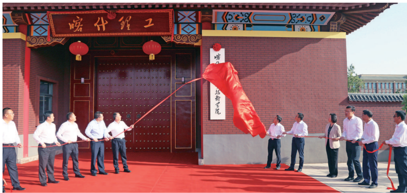
▲喀什理工职业技术学院正式揭牌成立

2018年，上海市教委成立上海职业教育对口帮扶工作协调小组，设在上海市教育委员会教育技术装备中心，协调小组积极发挥牵头作用。2023年，上海依托沪喀、沪果、沪滇三大职教联盟，28个职教集团及本市相关职业院校开展对口支援助力乡村振兴工作，进一步巩固拓展了教育脱贫攻坚成果，持续输出上海职教智慧和力量，帮助新疆喀什、青海果洛和云南等地的职业学校完善人才培养专业规划，提升教师队伍水平，深化产教融合机制，培养更多大国工匠。在三大职教联盟的努力下，各地职业教育纷纷结出累累硕果。