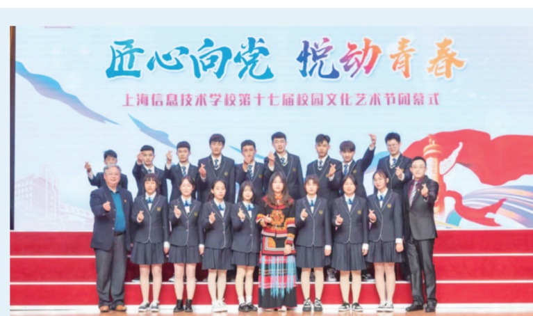
▲沪滇职教联盟成员校中，滇西学子积极参与学校各类艺术展演活动

9月16日，喀什理工职业技术学院迎来首届开学典礼。未来三年，沪喀职教联盟将聚焦喀什理工职业技术学院的专业内涵建设、教师能力培养、学