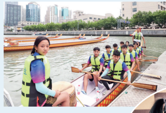
▲沪滇职教联盟成员校中，滇西学子通过赛龙舟、组建舞龙队等方式提升综合素质 ▼上海对口帮扶地区学生开展艺术教育

生课程设置、就业创业指导等重点环节，落实“以校包系”“校企合作”协议，助力喀什理工职业技术学院高起点开局、高质量发展。