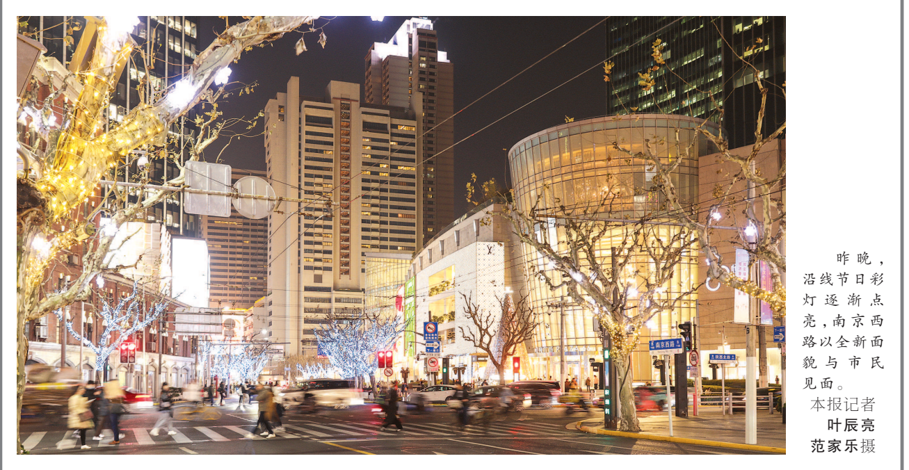
昨晚，沿线节日彩灯逐渐点亮，南京西路以全新面貌与市民见面。

■本报记者 王宛艺 从中信泰富广场的露台取景，俯瞰南京西路静安段，镜头中的马路犹如一湾星河，车水马龙间光影变幻。昨晚，静安区跨年迎新购物季暨南京西路“千亿商圈”新年亮灯仪式举行。 点亮的不仅是灯。今年以来，紧扣打造上海“国际消费中心城市示范区”发展目标，静安区有力有序推进南京西路“千亿商圈”建设，通过提升消费能级、发力消费供给、激发消费动能、优化消费环境等举措，打造贯穿全年的主题促消费活动，商圈零售全年预计同比增长14%。时值岁末，即将迎来元旦、春节等传统文化节庆及消费旺季，静安区联动南京西路、苏河湾、大宁3个商圈，做优夜间经济与露台经济融合，聚焦品质消费、创新消费体验，持续打造消费热点，开展一系列跨年迎新主题活动，全面提升消费繁荣度、商业活跃度。 作为上海“全球新品首发示范区”，南京西路商圈吸引着大量高能级品牌入驻，也成为各类全球潮流精品发布、首发活动集聚的首选地。此次跨年迎新购物季期间，大牌香水与美容产品专卖店在上海恒隆广场开幕，为消费者提供沉浸式专属服务。法国知名时尚珠宝品牌快闪店登陆兴业太古汇，带来融合时尚设计与精湛工艺的沉浸式体验。 此外，2024年静安区宝藏店铺新年City Walk活动同步启动，向消费者推荐静安区区内宝藏店铺，打造具有年轻力、烟火气、时尚潮和上海味的美好消费体验。 “‘千亿商圈’内，支马路、背街小巷这些‘毛细血管’，和主街‘主动脉’相辅相成，构成了完整商业生态。”静安区商务委副主任王艳说，逐渐发力的后街经济也丰富了商圈多元消费需求，也带来更多丰富的创新业态。