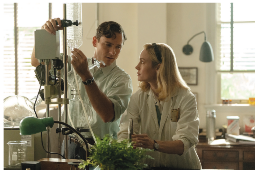
剧集不仅刻画了人物的精神世界，更突出了这一精神世界的支撑点，那就是化学。图为《化学课》剧照。

随后的第七集又讲回了凯文认识伊丽莎白以前的故事。凯文曾长期与一位黑人牧师通信。一开始是黑人牧师听了凯文的科学讲座，主动给凯文写信，他认为凯文还需要一个视角，那就是神学的视角。他们两个人的观点不一样，但这种多视角的交流无疑丰富了他们各自的生活。牧师的父亲得了重病，只想祈祷，不愿治病，凯文推荐给他药品，让他们千万要试一试，最后父亲同意治疗。凯文向牧师吐露心声，说自己不想结婚成家，决定才然一身地活下去。而牧师却相信他会得到爱。当凯文告诉牧师他得到爱情后，牧师也由衷地高兴。凯文的早逝中断了神学家和科学家的对话，但在牧师调到伊丽莎白生活的地方工作后，牧师又建立了与女