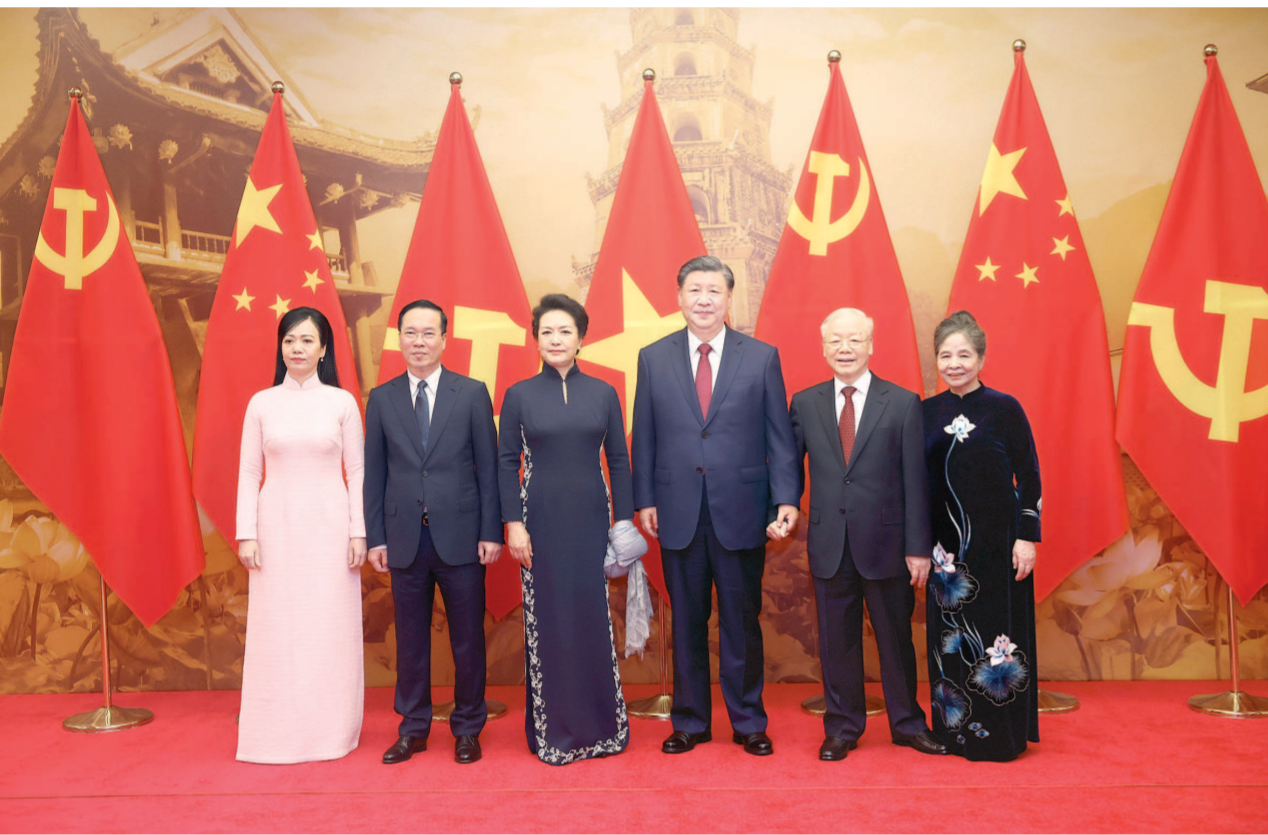
这是当晚，越共中央总书记阮富仲夫妇、越南国家主席武文赏夫妇共同向习近平和彭丽媛举行盛大欢迎宴会。