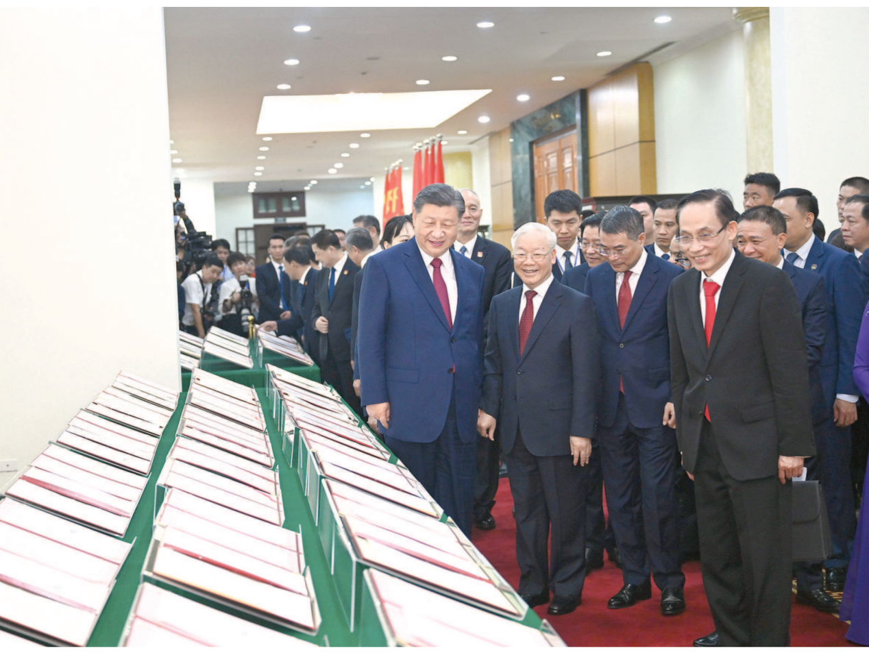
当地时间12月12日下午，刚刚抵达河内的中共中央总书记、国家主席习近平在越共中央驻地同越共中央总书记阮富仲举行会谈。这是会谈后，两党总书记共同见证双方签署的双边合作文件展示。