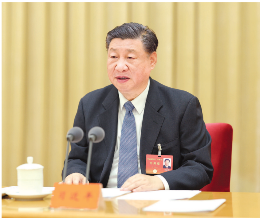
12月11日至12日,中央经济工作会议在北京举行。中共中央总书记、国家主席、中央军委主席习近平出席会议并发表重要讲话。

习近平出席中央经济工作会议并发表重要讲话 抓住一切有利时机,利用一切有利条件,看准了就抓紧干,能多干就多干一些