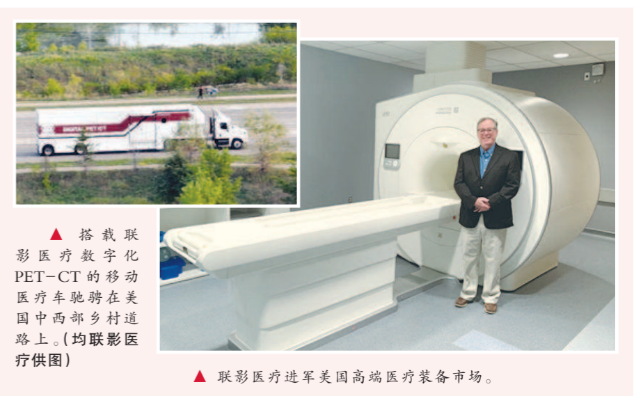
▲搭载联影医疗数字化PET-CT的移动医疗车驰骋在美国中西部乡村道路上。