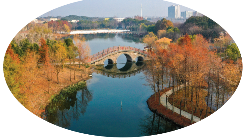
▲图为金海湿地公园

上海在水质提升、河道治理、景观打造、农村人居环境整治等多方面取得了丰硕成果,应抢抓小微湿地发展机遇,深入研究小微湿地演变和发展规律,结合各区不同湿地资源,多样化推进小微湿地的保护和建设。