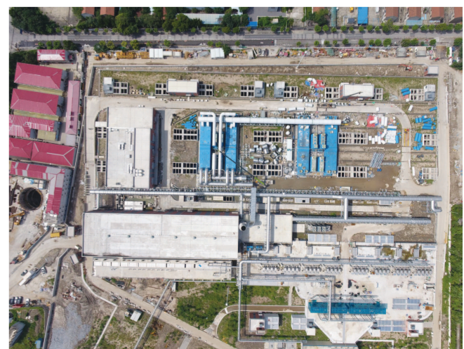
俯瞰竹园污水调蓄池。

竹园污水调蓄池工程于2019年12月26日开工。调蓄池建成后,与竹园片区现有污水处理设施协同工作。该工程设计综合考虑竹园片区运行水位、来水量波动等特点,通过多项设计优化,与“双碳”理念深度融合。充分利用合流一期水位,采用半地下结构以有效降低水泵能耗;顶板封闭配套高效除臭系统,防止臭气外溢;调蓄池主体分仓设计,可根据片区来水量情况及调蓄需求,逐仓启用调蓄池及对应的通风除臭设备,在增加运行灵活性的同时减少清淤养护工作量、减少设备运行能耗;半平台屋面种植结合透水排水,体现绿色海绵理念。