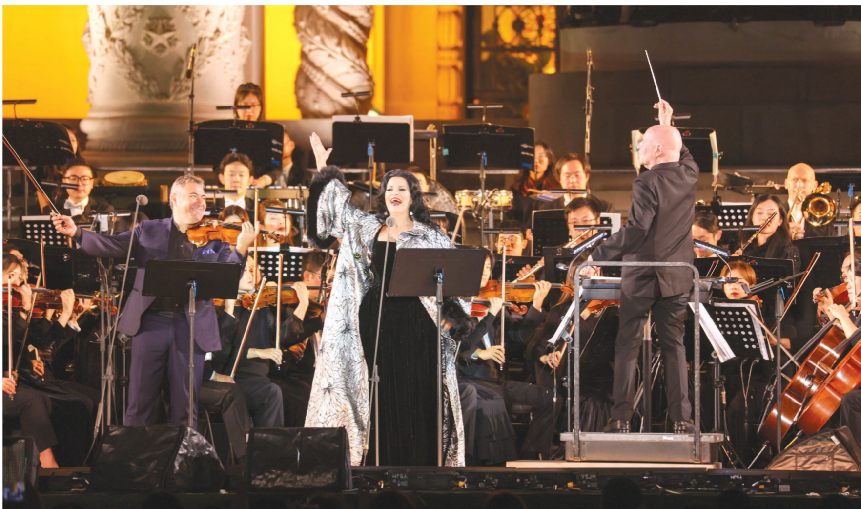
▲本届中国上海国际艺术节的第一场开幕演出，由著名指挥家艾森巴赫执棒新成立的上海国际艺术节节日乐团，携女高音歌唱家安吉拉·乔治乌和小提琴演奏家马克西姆·文格洛夫，在上海展览中心喷水池广场献上一场户外交响音乐会，开创了中外艺术合作的新典范。

文化是城市的灵魂。开放和包容，成就了上海的文化自信，铸就了上海的品质生活与城市温度。正是这样的上海，让众多艺术家如此牵挂、期待再次相会。