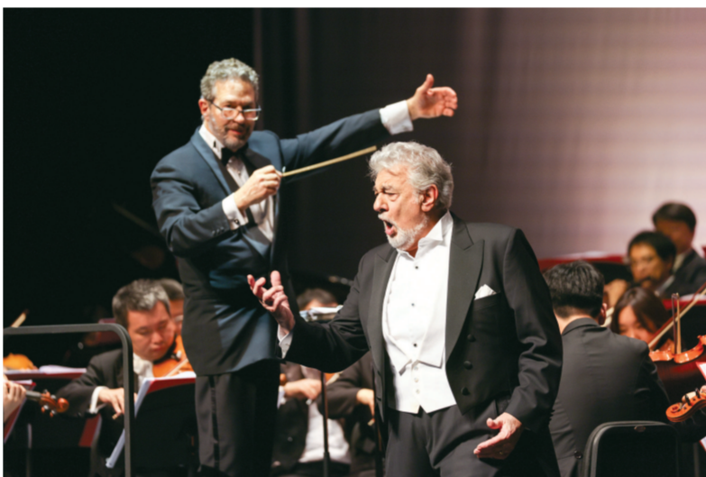
▲《普拉西多·多明戈2023上海音乐会》11月14日晚在交通银行前滩31演艺中心举行，多明戈携指挥艾金·科恩、女高音詹妮弗·罗利与青岛交响乐团联袂登台。