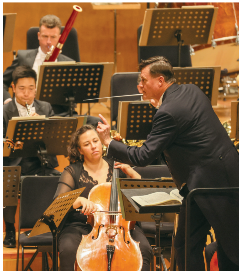
▶11月1日、2日两晚，被中国乐迷称为“大熊”的指挥大师克里斯蒂安·蒂勒曼，带着“世界最古老乐团”德累斯顿国家管弦乐团亮相上海东方艺术中心，奉上乐团今年新赛季开幕与475周年庆典音乐会选曲，点燃全场热情。