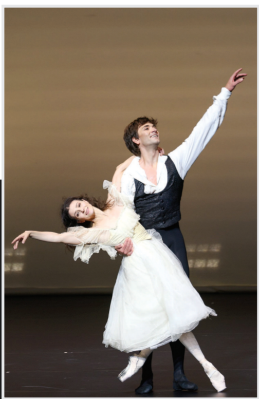
▲11月4日至5日，阿丽娜·科约卡鲁等9位世界知名芭蕾明星登上刚刚启幕的交通银行前滩31演艺中心舞台，带来精彩绝伦的芭蕾经典选段。这台名为《阿丽娜和她的朋友们》的演出，汇聚世界顶尖舞者，用炫技舞段让广大观众领略“足尖交响曲”的曼妙。