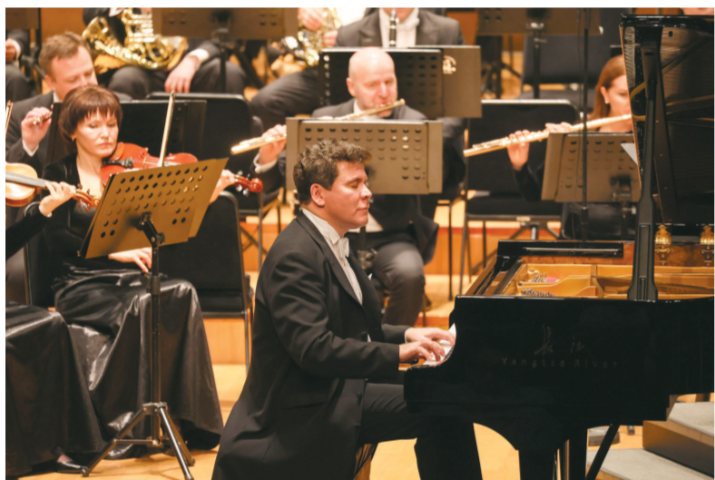
▲俄罗斯钢琴家丹尼斯·马祖耶夫11月3日亮相东方艺术中心，携指挥家亚历山大·斯拉德科夫斯基、陈正哲与俄罗斯鞑靼斯坦国家交响乐团，完成五首拉赫玛尼诺夫重磅钢琴曲的极限挑战。