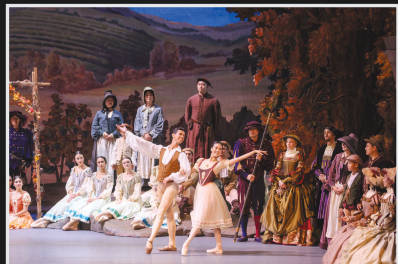
▼▶11月2日至5日，美国芭蕾舞剧院(ABT)时隔23年再次登台上海大剧院，一连五场演出开启亚洲巡演首站。

作为美国国宝级芭蕾舞演出团体，ABT此次亮相第22届中国上海国际艺术节，带来享有“芭蕾之冠”美誉的古典浪漫主义芭蕾舞剧《吉赛尔》(右图)，以及集三部横跨65年时光的现代芭蕾作品精粹《舞夜星辰》(下图)。上海歌剧院交响乐团受邀为《舞夜星辰》现场伴奏。