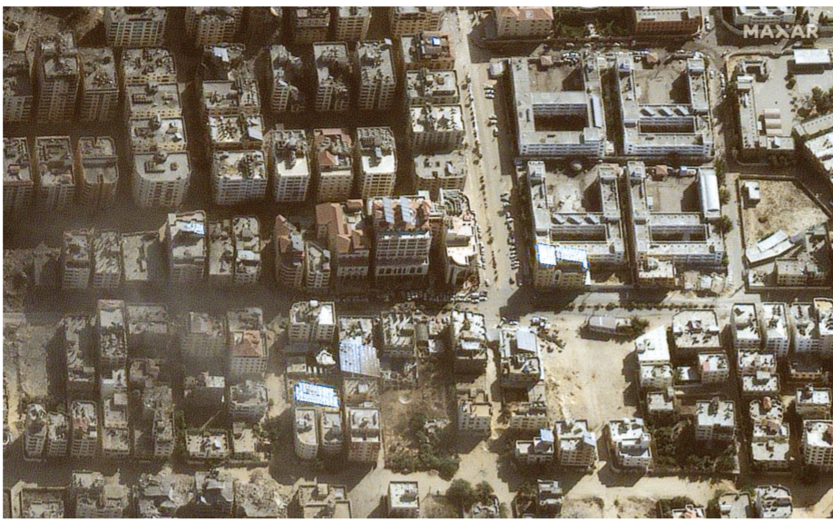
11日,在加沙地带拍摄的卫星图片显示圣城医院所在区域。