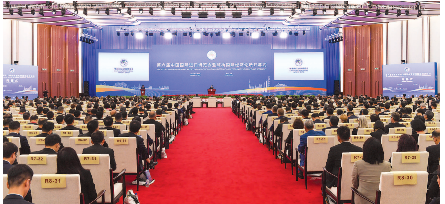
第六届中国国际进口博览会暨虹桥国际经济论坛开幕式在国家会展中心(上海)举行。