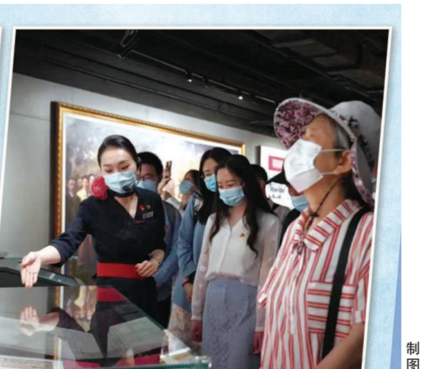
中共四大纪念馆开展志愿讲解。(资料照片)