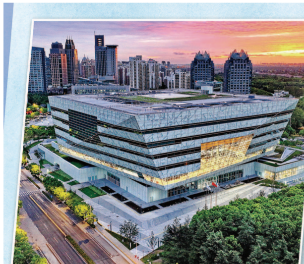
上图东馆成为上海城市文化新地标。(资料照片)