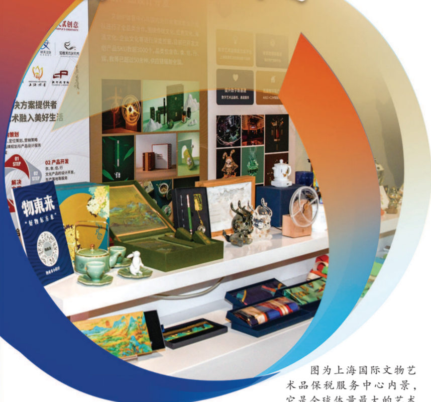
图为上海国际文物艺术品保税服务中心内景，它是全球体量最大的艺术品保税库，进博会的首批文化艺术品都在这里完成审批、查验手续，出发前往进博会场馆。