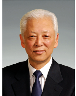
周铁农同志遗像

新华社北京11月3日电 著名的社会活动家，中国国民党革命委员会的杰出领导人，中国共产党的亲密朋友，第十一届全国人民代表大会常务委员会委员长，中国人民政治协商会议第九届、十届全国委员会副主席，中国国民党革命委员会第十一届中央委员会主席周铁农同志，因病于2023年11月3日16时15分在北京逝世，享年85岁。