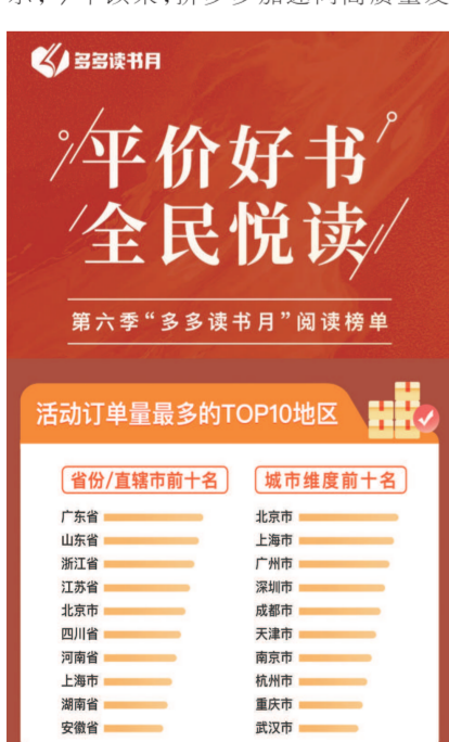
▲10月26日,第六季“多多读书月”活动收官