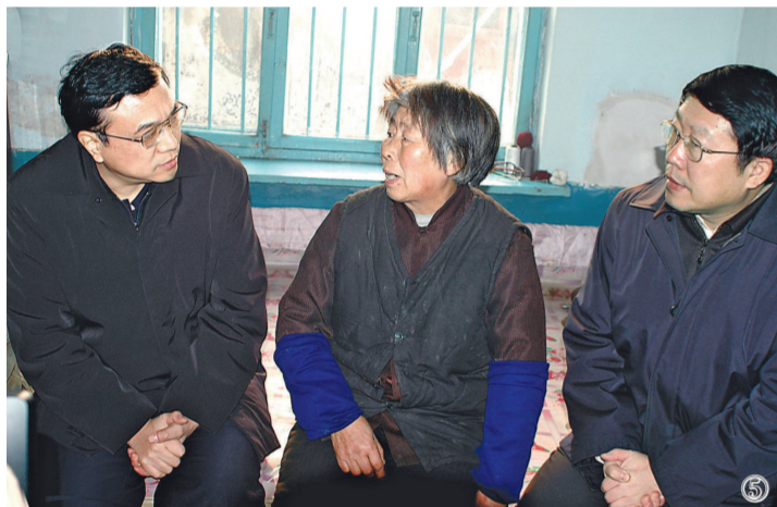
图⑤:2004年12月26日,李克强同志到辽宁省抚顺市莫地沟棚户区居民王淑贞家中走访调研。