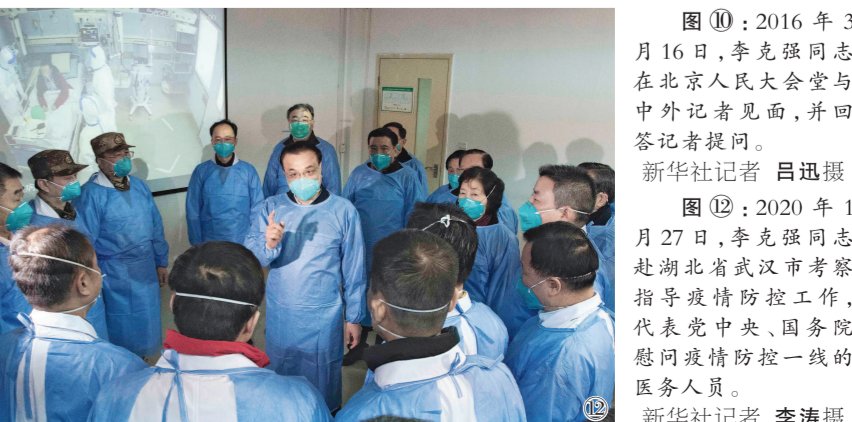
图⑫:2020年1月27日,李克强同志赴湖北省武汉市考察指导疫情防控工作,代表党中央、国务院慰问疫情防控一线的医务人员。