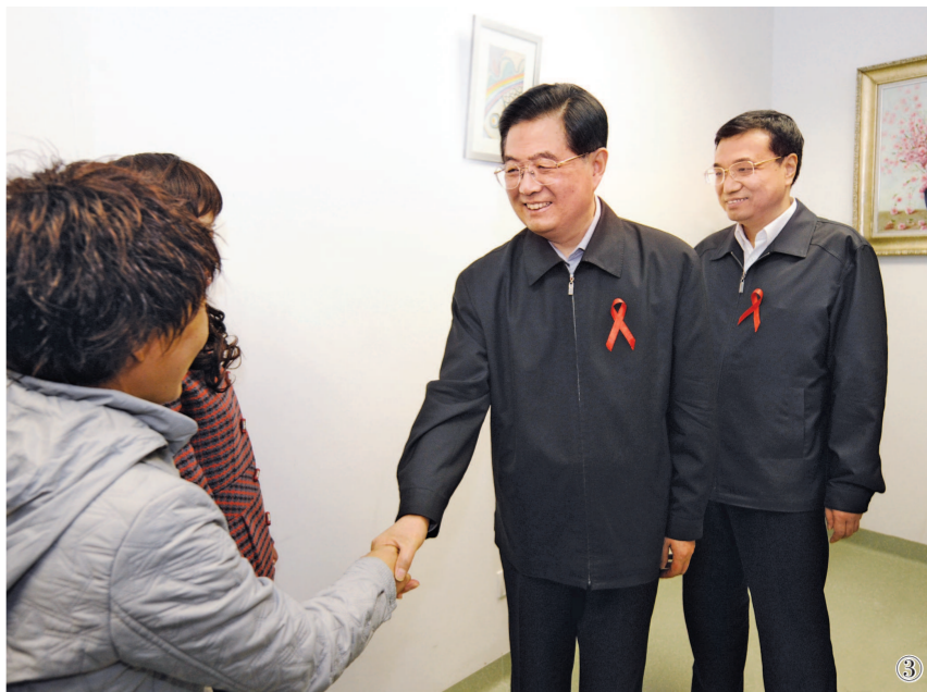
图③:2008年12月1日是第21个世界艾滋病日。胡锦涛同志和李克强同志来到北京地坛医院考察艾滋病防治工作。 新华社记者 马占成摄