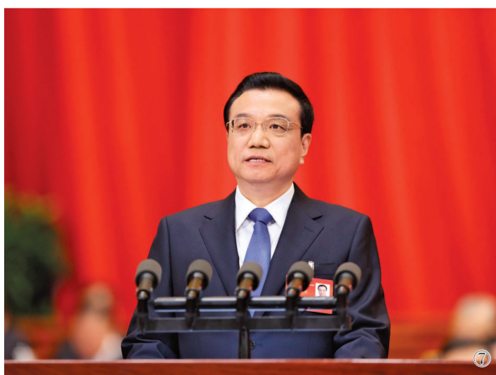
图⑦:2014年3月5日,第十二届全国人民代表大会第二次会议在北京人民大会堂开幕。李克强同志作政府工作报告。