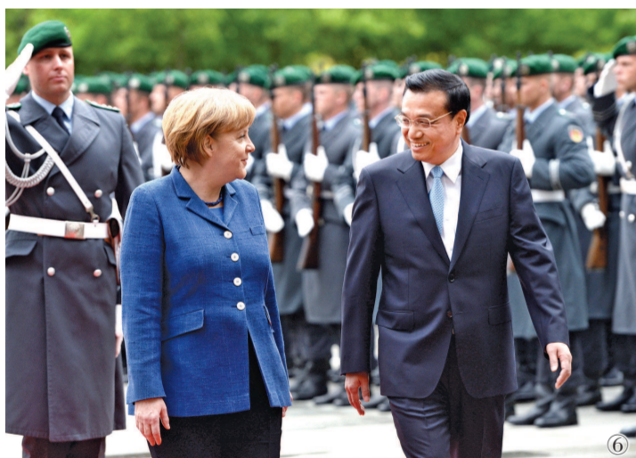
图⑥:2013年5月26日,李克强同志在柏林出席德国总理默克尔举行的欢迎仪式。