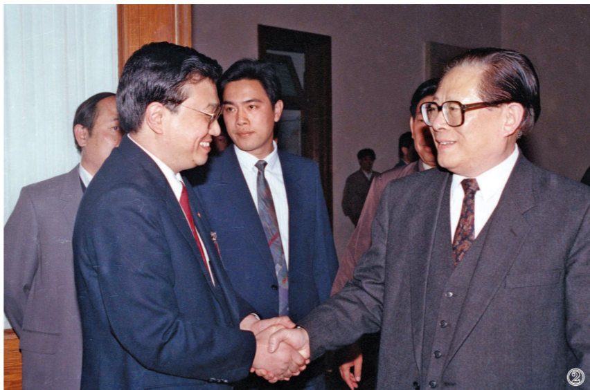
图②:1993年5月3日下午,中国共产主义青年团第十三次全国代表大会在北京人民大会堂开幕。在5月3日上午的预备会议后,举行第一次主席团会议,推选李克强等同志为主席团常务主席。这是江泽民同志与李克强同志握手。