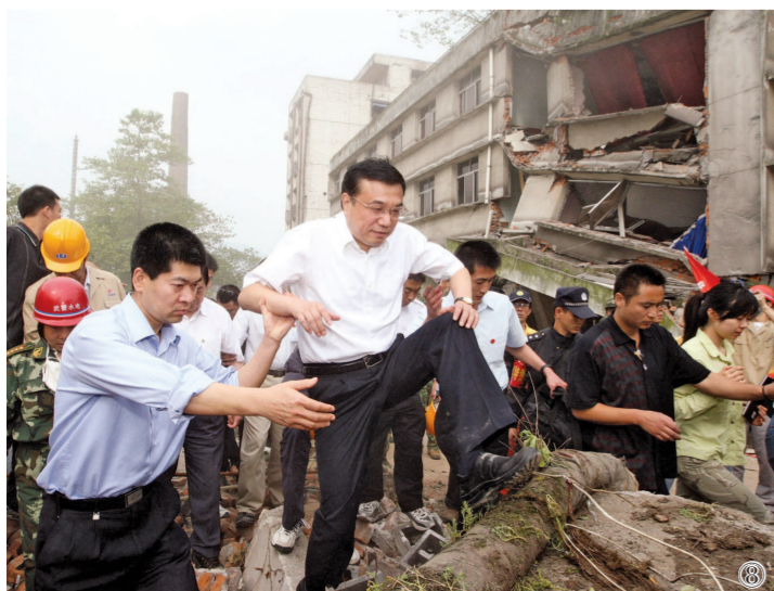
图⑧:2008年5月19日,李克强同志在四川地震灾区察看灾情。