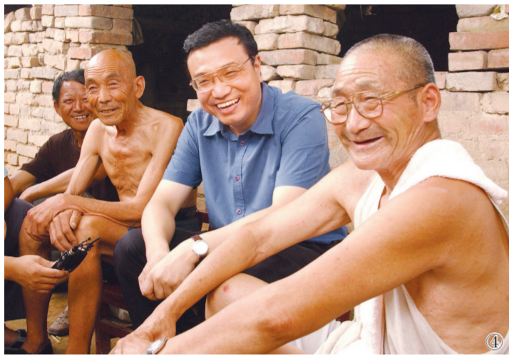
图④:2003年8月8日,李克强同志在河南省新乡市调研。这是李克强同志在原阳县桥北乡马庄村与村民亲切交谈。