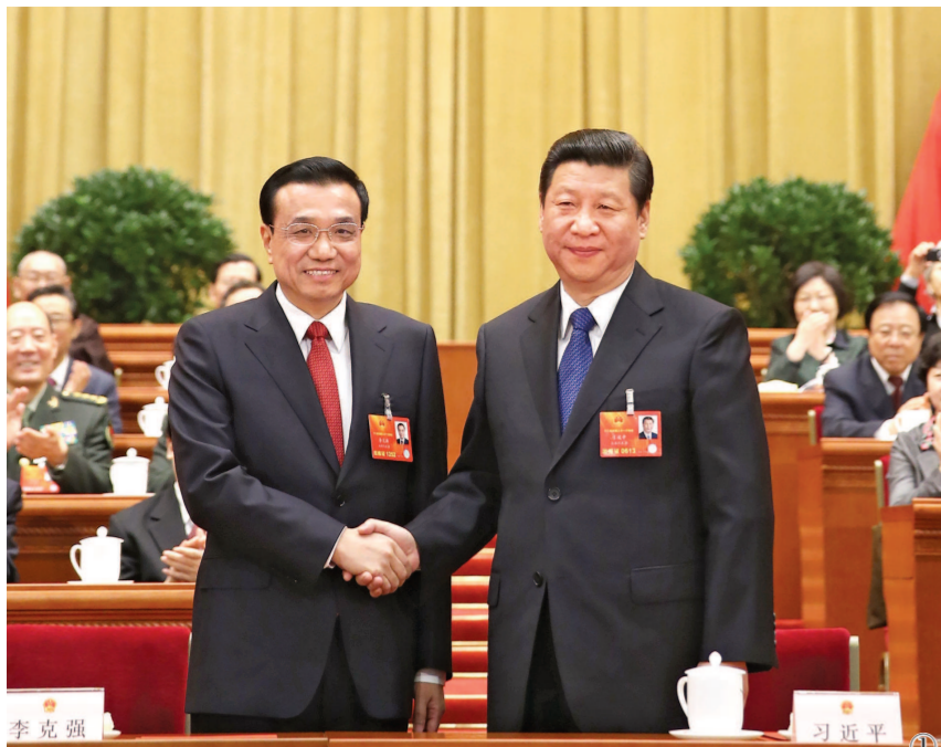
图①:2013年3月15日,第十二届全国人民代表大会第一次会议在北京人民大会堂举行第五次全体会议。会议经过投票表决,决定李克强为中华人民共和国国务院总理。这是习近平同志和李克强同志亲切握手。