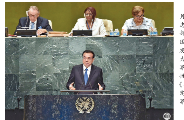
图⑪:2016年9月21日,李克强同志在纽约联合国总部出席第71届联合国大会以“可持续发展目标:共同努力改造我们的世界”为主题的一般性辩论并发表题为《携手建设和平稳定可持续发展的世界》的讲话。