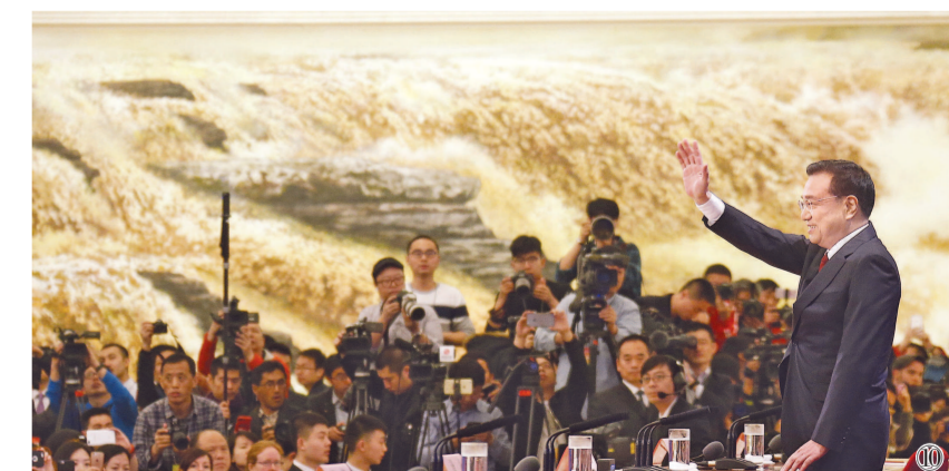
图⑩:2016年3月16日,李克强同志在北京人民大会堂与中外记者见面,并回答记者提问。