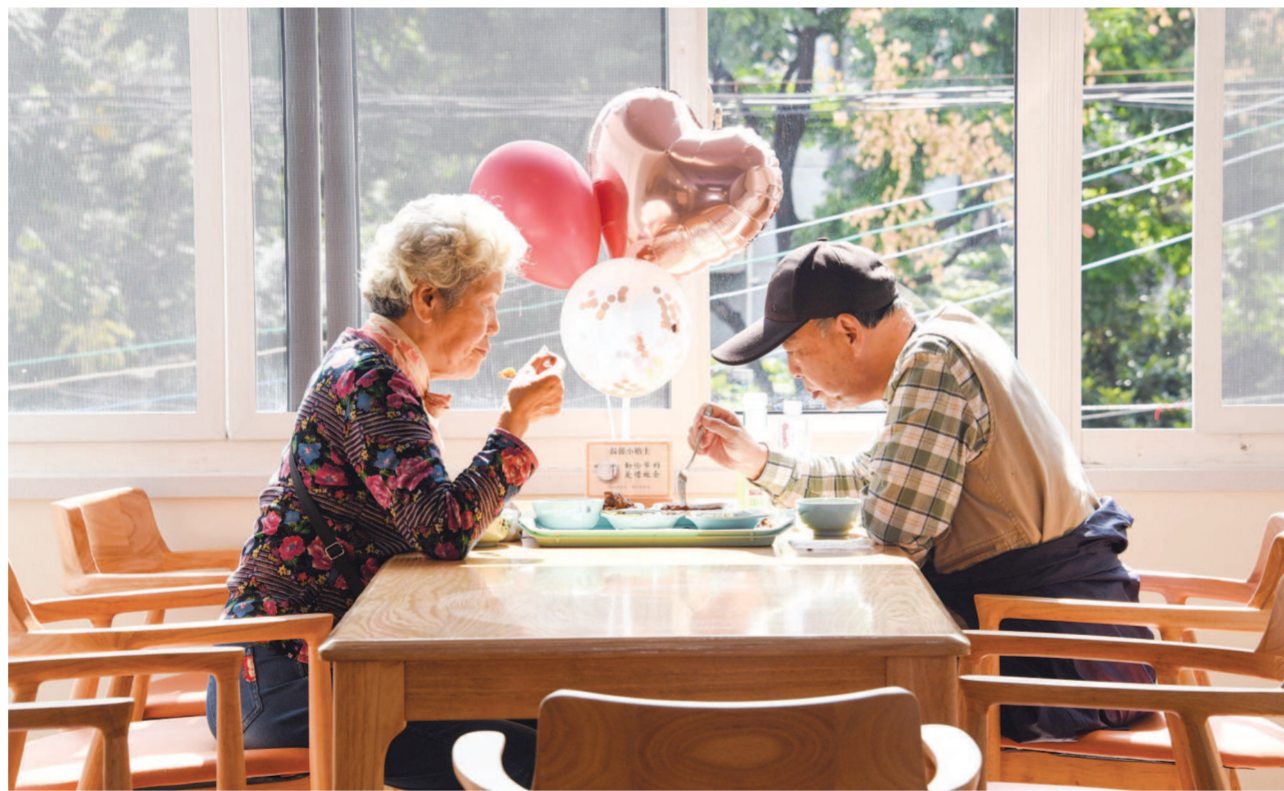
图为虹桥镇银馨社区食堂内用餐的老人。

社区食堂为何要建公益基金池?运营方负责人鲁小锋道出缘由,让社区食堂的盈利反哺更多老人,特别是那些无法走到社区食堂的老人。以银馨社区食堂为例,其汇集起的爱心资金将向社区内长期卧床老人等特殊困难老年人定向投放。结合区域特点,这个公益基金池还能因地制宜,挖掘开发更多个性化的为老项目。