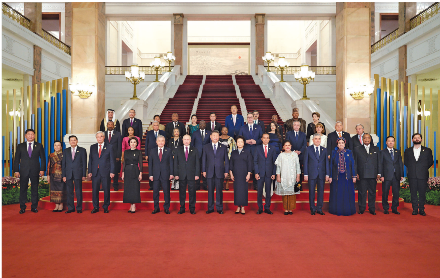
10月17日晚，国家主席习近平和夫人彭丽媛在北京人民大会堂举行宴会，欢迎来华出席第三届“一带一路”国际合作高峰论坛的国际贵宾。这是习近平和彭丽媛同国际贵宾合影留念。