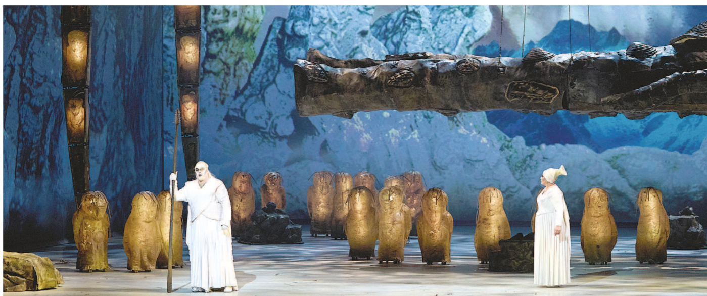
捷杰耶夫将携马林斯基剧院的歌剧《尼伯龙根的指环》今晚起登上上海大剧院。图为《莱茵的黄金》剧照。

昨天,面对上海媒体,俄罗斯指挥家瓦莱里·捷杰耶夫感触颇多,他感怀与上海大剧院持续多年的情分,也寄希望于跨文化的交流对话改变充满纷争的世界。