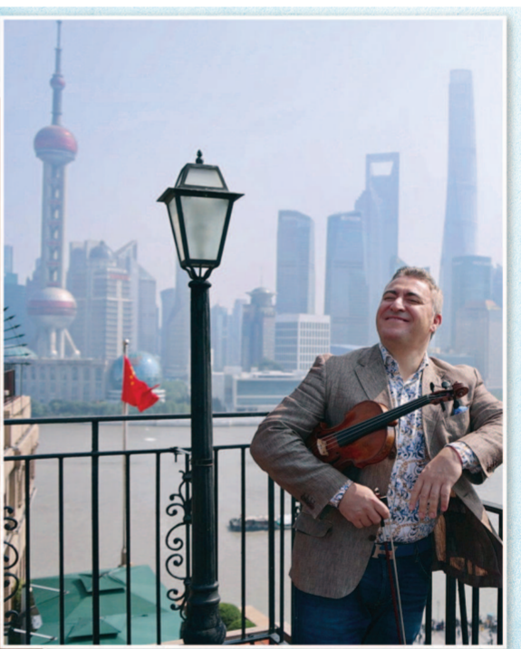
▲钟爱在露天场景中演奏的马克西姆·文格洛夫走上和饭店的露台。 ▲文格洛夫前晚在上海展览中心喷泉广场的开幕音乐会上演奏。 制图:张继

年前出任上海斯特恩小提琴国际大赛评委的经历,他感慨中国孩童基数庞大,许多孩子在很小的年纪就技艺非凡。