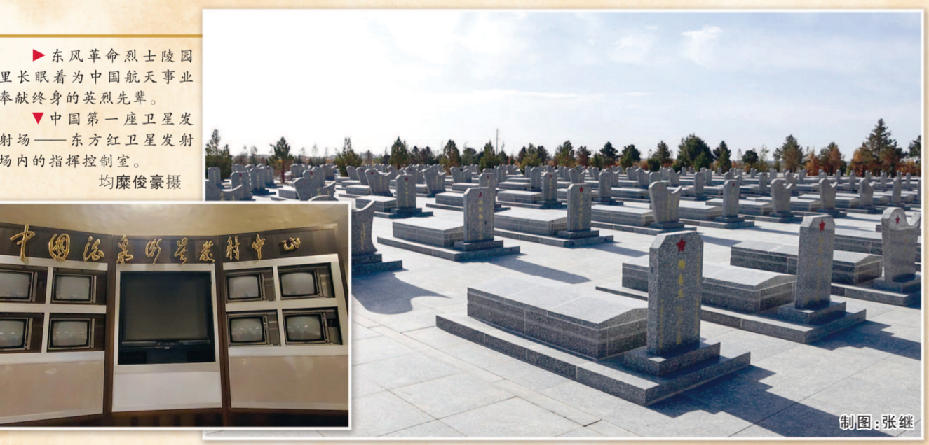
► 东风革命烈士陵园里长眠着为中国航天事业奉献终身的英烈先辈。 ▼ 中国第一座卫星发射场——酒泉卫星发射场内的指挥控制室。