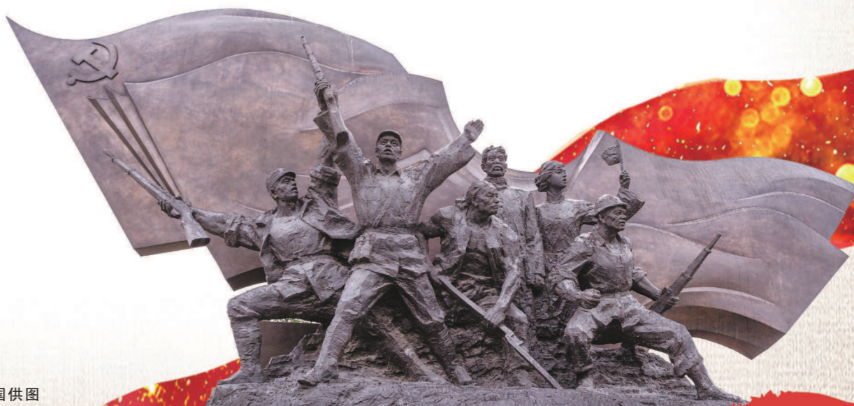
右图:安徽省合肥市新四军第四支队东进抗日纪念馆群雕。

半个多世纪以来，一代又一代的“东风人”如胡杨一般在戈壁扎根，接续奋斗，铸就了“特别能吃苦、特别能战斗、特别能攻关、特别能奉献”的载人航天精神。