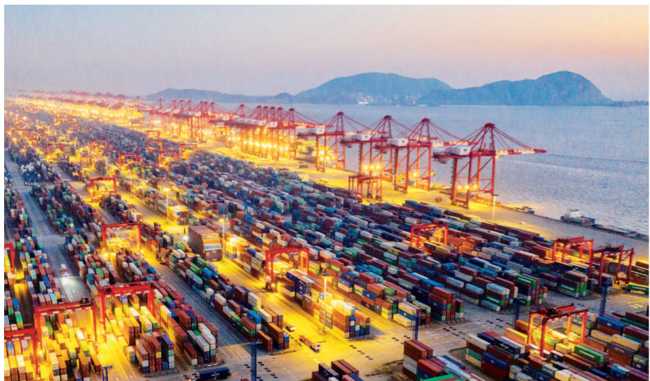
上海洋山四期自动化码头夜景。