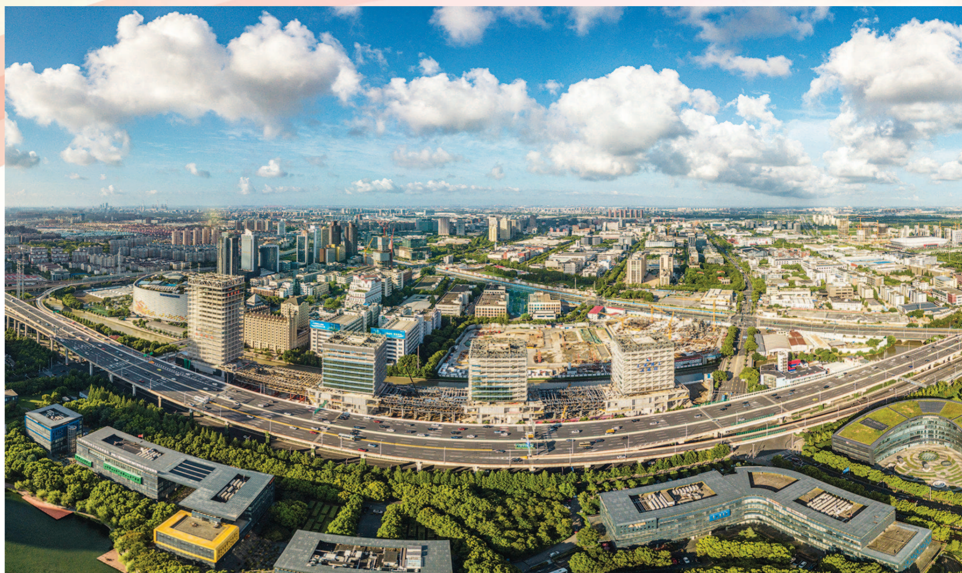
金桥开发区纳入上海自贸试验区扩区范围后，聚焦贸易便利化和投资便利化开展制度创新，扩大溢出效益、扩展辐射效应，将原有的汽车制造、电子信息、家用电器、食品和生物医药等传统支柱产业，与互联网、大数据、人工智能不断融合发展，转型升级为现在的“未来车”“智能造”“大视讯”三大硬核产业。