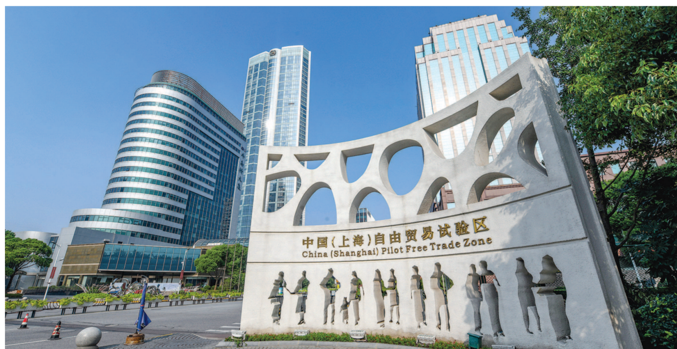
外高桥保税区内“中国(上海)自由贸易试验区”门牌。