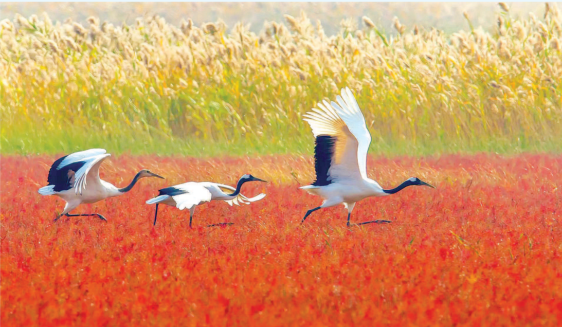
盐城兼具海洋、湿地、森林三大生态系统,拥有582公里的海岸线、76.96万公顷湿地面积,其中近海与海岸湿地约52.15万公顷。(受访者供图)

本报讯(记者赵征南)2023全球滨海论坛会议昨天在江苏盐城开幕,会议旨在与各方共商滨海区域的保护和发展,共享人与自然和谐共生的理念和实践,共谋滨海区域协同治理的愿景和对策。